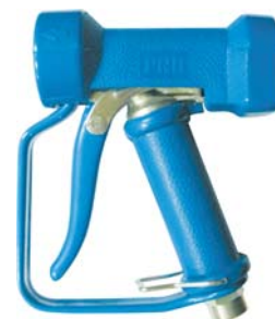
UMV 2210 xx